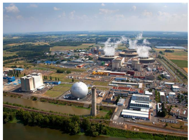
Centrale de Chinon

A 20h15, l'équipe se réunit à nouveau pour le débriefing : chacun évoque les éléments marquants de son quart, puis chaque agent attend son remplaçant pour lui transmettre sa relève avant le quart de nuit. C'est ainsi que les équipes de Conduite assurent la sûreté nucléaire 24h/24, 7j/7, tout en continuant à produire l'électricité qui alimente nos foyers.